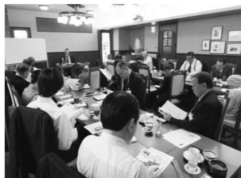
熱心に聞き入るメンバー

メで一躍有名となった物語『フランダースの犬』の舞台でもあります。フランダースは歴史的にも古く、中世は北イタリアと共に経済的にも豊かな地でした。アントワープの次に大きい都市はアントワープです。海に面していないのに港町で、運河があり、スヘルデ川でつながっていますので重要な町となっています。ホンダがオートバイの工場を持っており、日本で最初に投資したのがホンダです。そしてブルージュ、とても観光的な町で、天井のない博物館とも言われており、歴史が今も生きています。今は海から25km離れていますが、中世の時は海に面しており、港町で経済的にも豊かでした。