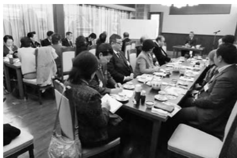
熱心に聞き入るメンバー

そして日本の統治時代に入ります。明治になって日本の安全を考えると仮想敵国は中国、ロシアであり、朝鮮半島の安定安全が日本の安定安全につながります。そんな中、当時の李王朝で暴動が起こり、中国と日本に派兵を要請、治安の後、日本は引き揚げますが、中国は兵を出し続け、このことは日本にとって危険な兆候です。そこで起きたのが日清戦争です。日本は勝利し、三国干渉にあって返還することになった遼東半島をもらって、台湾を割譲されました。台湾をどう統治していくのか。台湾は植民地ではなく領土ですので日本の延長として、武備の関門と、生産物を増やし産業を盛んにするということを考え、ダムを造って、平野部には水路を作り、それは網の目の様で万里の長城より長いと言われています。台北市内は下水道が完備され、ここに植民地と領土の違いがあります。日本語学校を作って6人の先生方が派遣されますが、風評被害によって残念ながら殺