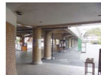
集合場所 (この屋根の上が一般道路です)