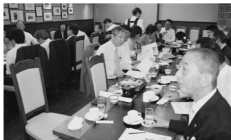
熱心に聞き入るメンバー

近頃、あらゆる施設にAEDが設置されるようになってきました。4～5年前に衝撃的なビデオを見せられ、AEDが初めて使われて、普及につながるきっかけになったと思われま。カジノで儲けた人が興奮して倒れてしまいました。お酒を飲んでおり、お金持ちで小太り、興奮すると血圧が上がって心臓や体にいいことはありません。倒れた人にAEDをして蘇生したというものでした。やったのは医者ではなく警備員、それが学会で発表され、私たちにとても非常に衝撃的でした。愛知万博の時に、AED設置のお蔭で何人か助かったという話もあります。段々と蘇生法、救急法が進化してきています。